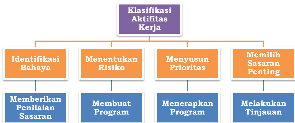
Gambar 1. Bagan Manajemen Risiko

Untuk menerapkan manajemen risiko dalam sebuah organisasi, dalam Gambar 1 ditunjukkan bagan manajemen risiko, dan Gambar 3 merupakan langkah pengelolaan risiko.