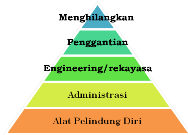
Gambar 2. Hirarki Pengendalian Risiko

Hirarki/urutan dalam pengendalian risiko dapat dilihat dalam gambar berikut ini.